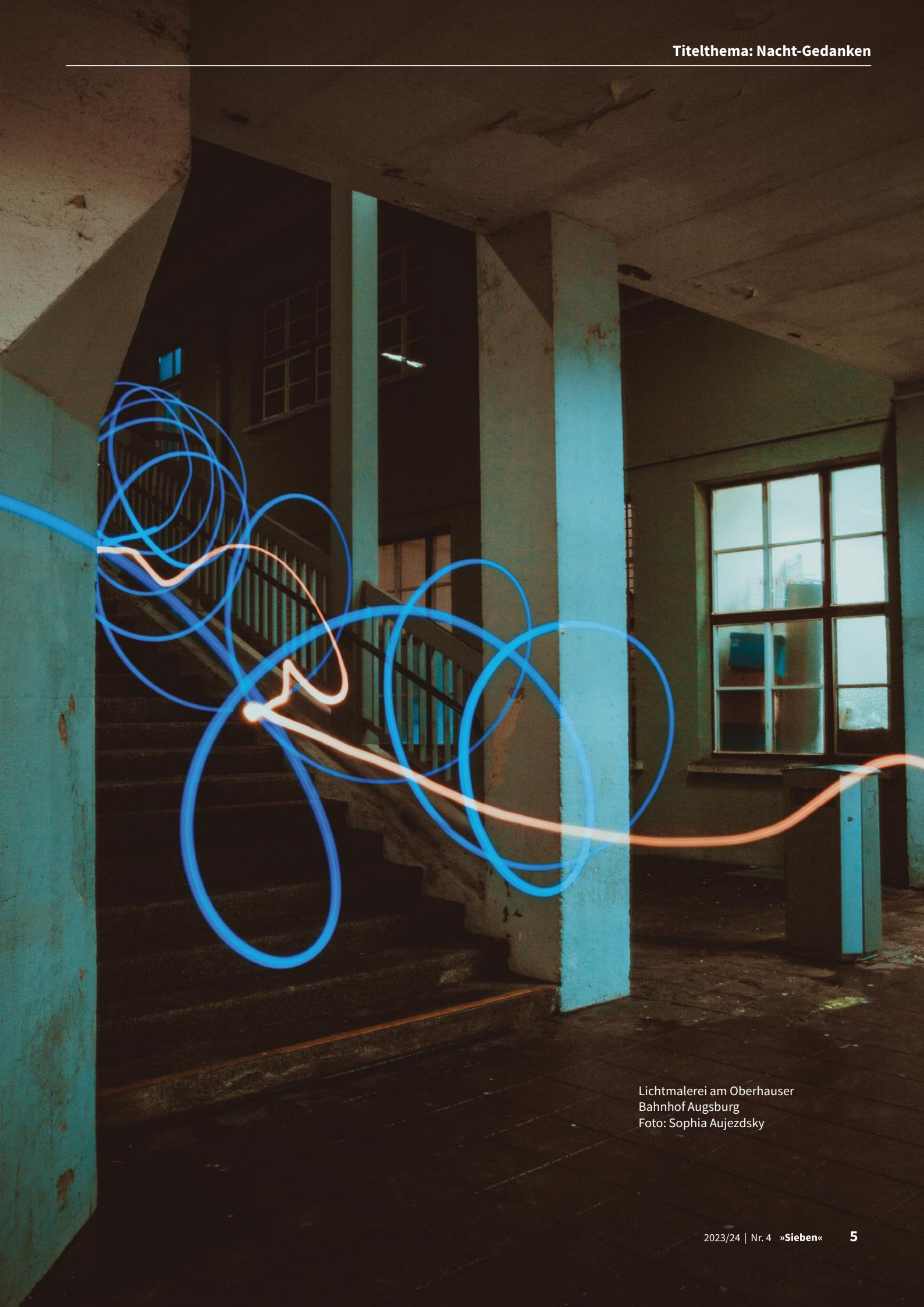
Lichtmalerei am Oberhauser Bahnhof Augsburg