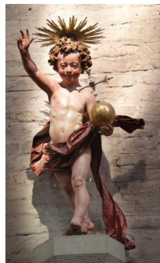
Christkind in der Kirche Zu den Barfüßern, vor Zerstörung gerettet in der Augsburger Bombennacht 1944

9:30 Zu den Barfüßern , Gottesdienst (M. Beck) 9:30 St. Jakob Gemeindesaal , Gottesdienst (Sokol) 10:00 St. Andreas , Eltern-Kind-Gottesdienst (Maiwald) 10:00 St. Anna , Gottesdienst (Offenberger)